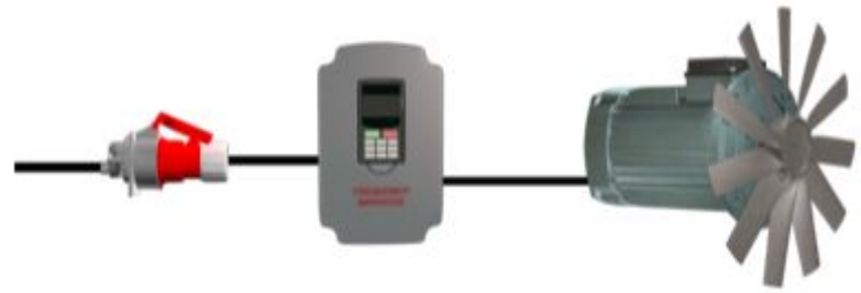
Motor drives with frequency inverter